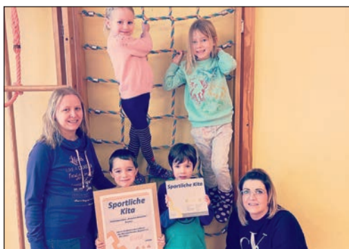
Glückliche Kinder und Erzieherinnen

Der Kreissportbund Bautzen e.V. zeichnet Kitas aus, die Bewegung aktiv in den Alltag der Kinder einbinden. Die Auszeichnung wird in den Kategorien Bronze, Silber und Gold verliehen. Die Kita „Benjamin Blümchen“ hat alle Anforderungen für den Gold Status erfüllt. Am Freitag, dem 16. Dezember 2022 wurde das Zertifikat „Sportliche Kita“ durch den Kreissportbund an die Kinder der Vorschulgruppe übergeben. In der städtischen Kita „Benjamin Blümchen“ wird Bewegung großgeschrieben. Der Tag beginnt mit einem bewegten Morgenkreis und auch während des Tagesablaufes ist viel Platz für Sport und Bewegung. Die beiden ältesten Kindergruppen besuchen einmal in der Woche den Sportunterricht beim Kooperationspartner MSV Bautzen. Dazu laufen die Kindergruppen in den nahegelegenen Sportpark des MSV und werden von einer ausgebildeten Trainerin des MSV trainiert. Aufgrund dieser körperlichen Förderung konnten die Kinder bei den jährlichen Wettbewerben schon einige Medaillen und Pokale für die Kita „Benjamin Blümchen“ gewinnen.